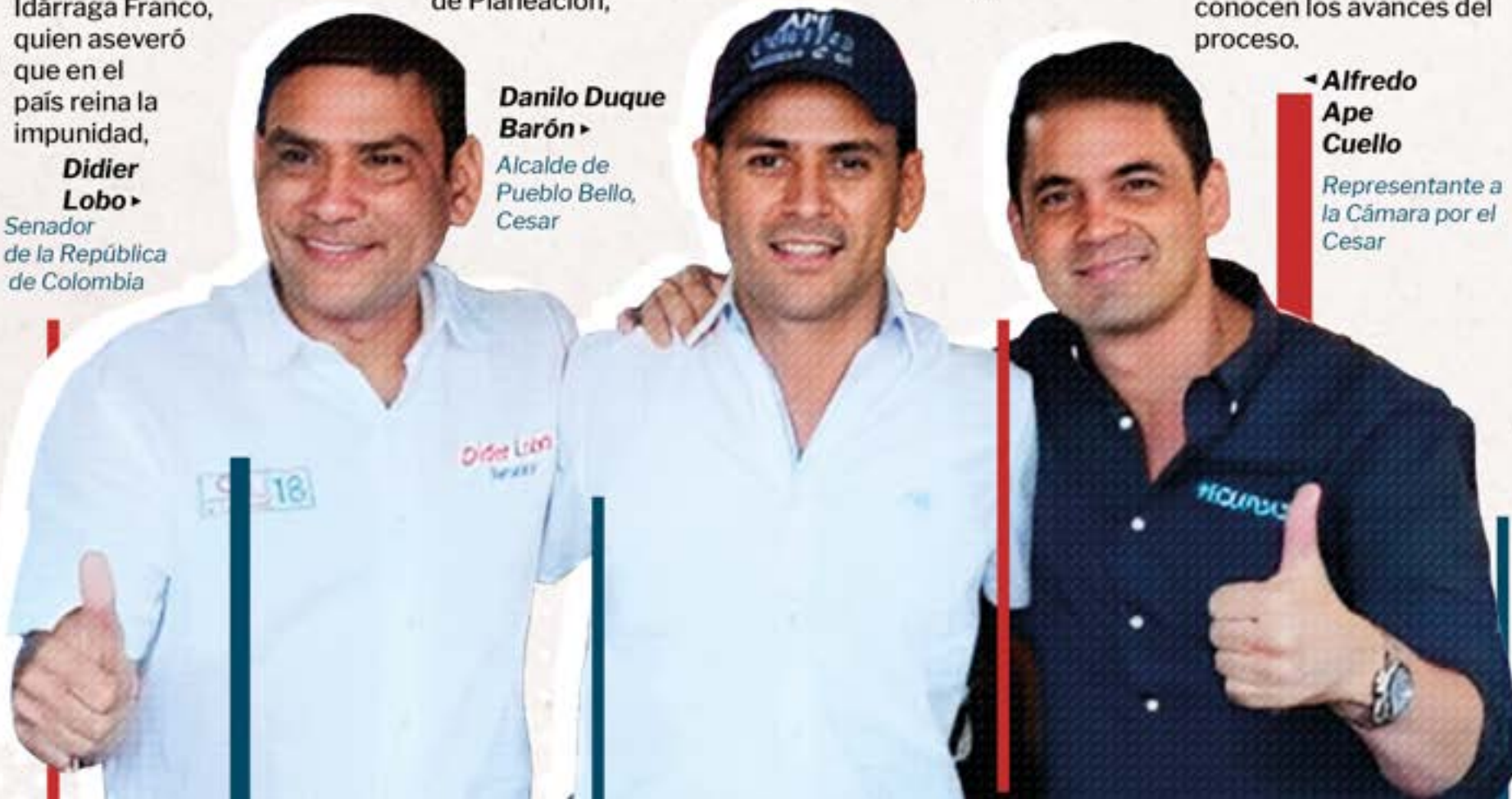
Danilo Duque Barón Alcalde de Pueblo Bello, Cesar

Por el contrario, a lo realizado por los entes de control El Periódico conoció de forma detallada, a través de las plataformas de datos utilizadas por Transparencia por Colombia, los detalles de la irregularidad cometida por el alcalde Danilo Duque Barón ; este organismo hizo un cruce de información entre la plataforma de Cuentas Claras del CNE, la plataforma de contratación Secop y las bases de datos de la Registraduría que permite del municipio de Pueblo Bello para el año 2019, año en el que se realizaron las elecciones.