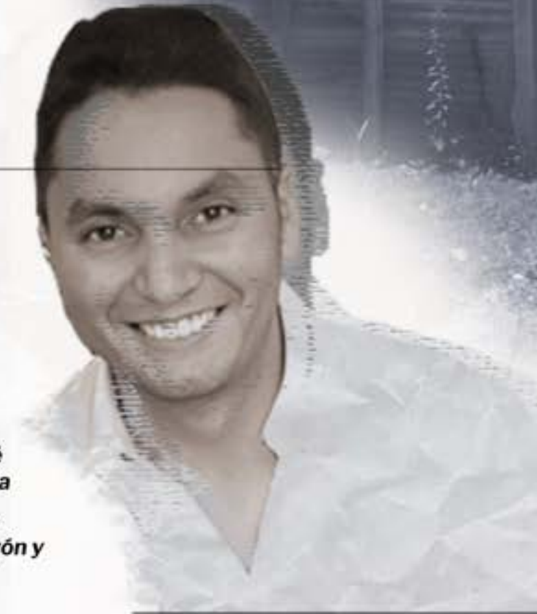
Representante legal del Consorcio Viveurb 2021