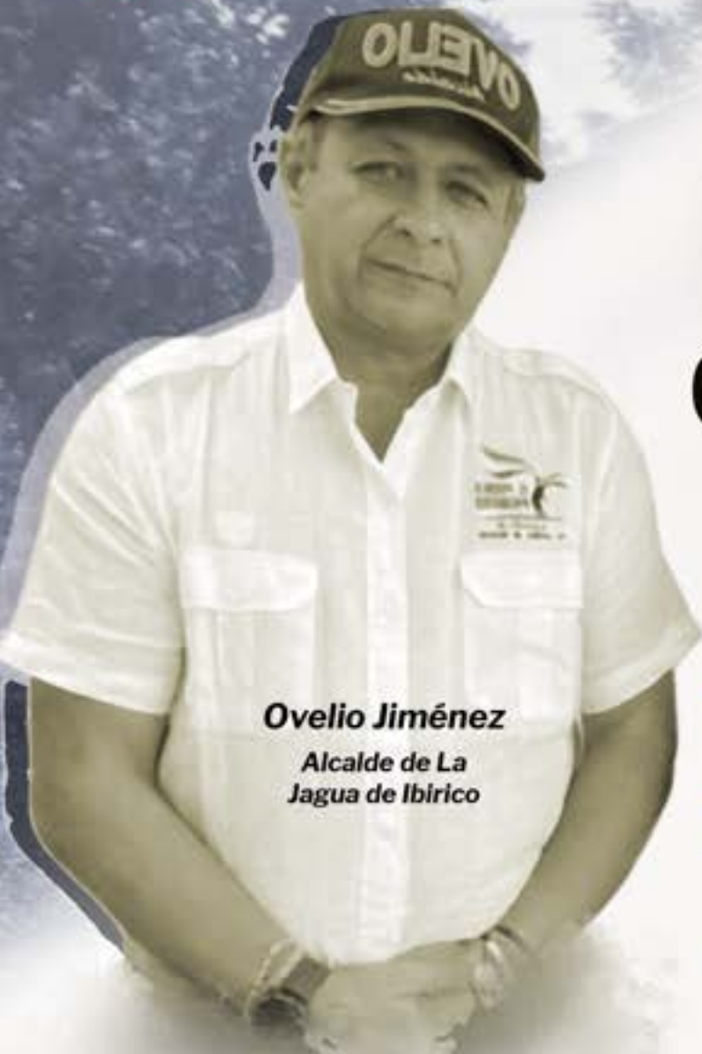
Ovelio Jiménez Alcalde de La Jagua de Ibirico